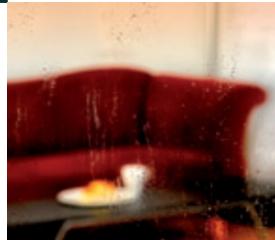
Ohne SGG BIOCLEAN