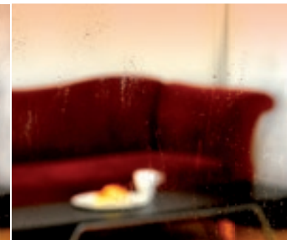
Mit SGG BIOCLEAN