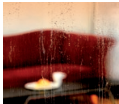
Ohne SGG BIOCLEAN